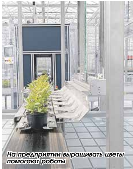
На предприятии выращивать цветы помогают роботы