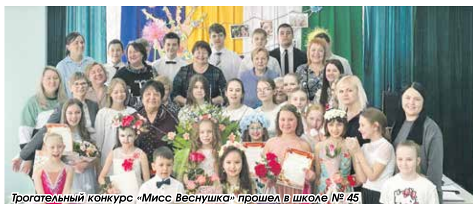
Трогательный конкурс «Мисс Веснушка» прошел в школе № 45