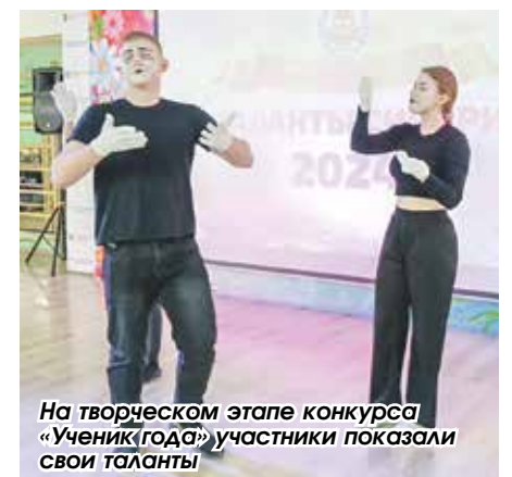
На творческом этапе конкурса «Ученик года» участники показали свои таланты