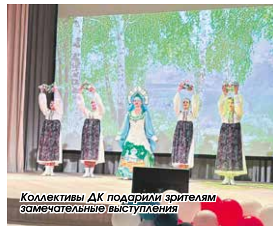
Коллективы ДК порадовали зрителей замечательными выступлениями