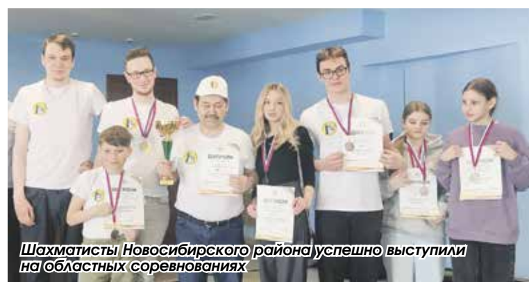
Шахматисты Новосибирского района успешно выступили на областных соревнованиях

Подготовил Владислав Кулагин, фото предоставлено Камилем Тухфатулиным