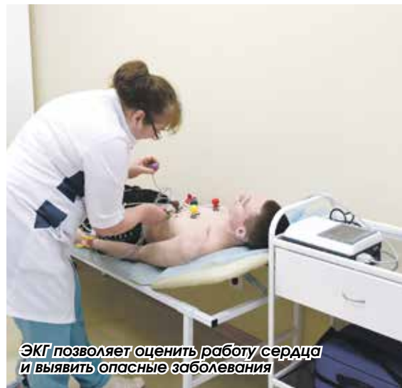
ЭКГ позволяет оценить работу сердца и выявить опасные заболевания

В поликлинике нет больших очередей. Можно прийти с утра и взять талончик на прием к врачу, можно заранее записаться по телефону и прийти в определенное время. Для удобства пациентов кабинеты профилактики изолированы от общего потока посетителей – выделено отдельное крыло. Это значит, что больные и здоровые люди не соприкасаются друг с другом.