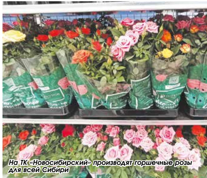
На ТК «Новосибирский» производят горшечные розы для всей Сибири