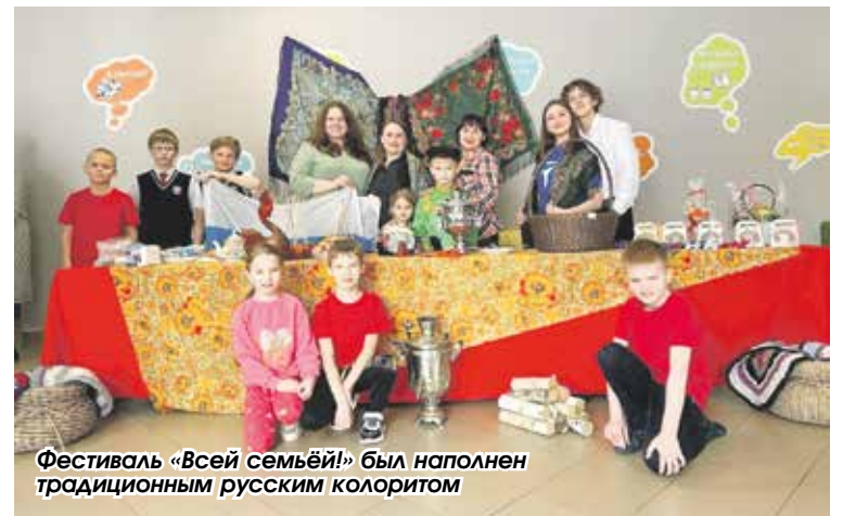
Фестиваль «Всей семьей!» был наполнен традиционным русским колоритом

Информация и фото местного отделения «Движения первых»