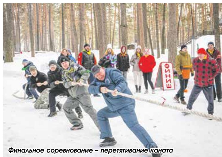
Финальное соревнование – перетягивание каната