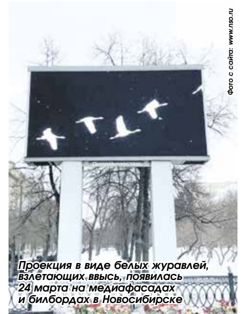
Проекция в виде белых журавлей, взлетающих ввысь, появилась 24 марта на медиафасадах и билбордах в Новосибирске

Во многих городах России и за рубежом в первые часы после трагедии возникали стихийные мемориалы, люди, желая показать свою скорбь, выразить соболезнования, возлагали цветы, зажигали свечи. На зданиях были приглушены государственные флаги, отменены развлекательные и спортивные мероприятия. Во всех регионах введены дополнительные меры антитеррористического и противодиверсионного характера. 24 марта был объявлен днем траура.