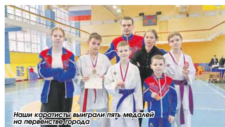
Наши каратисты выиграли пять медалей на первенстве города

Подготовил Владислав Кулагин