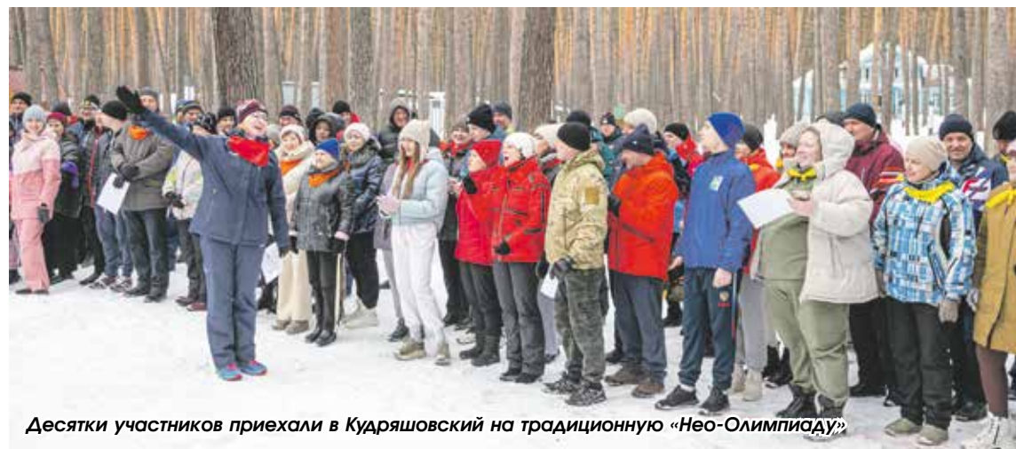
Десятки участников приехали в Кудряшовский на традиционную «Нео-Олимпиаду»