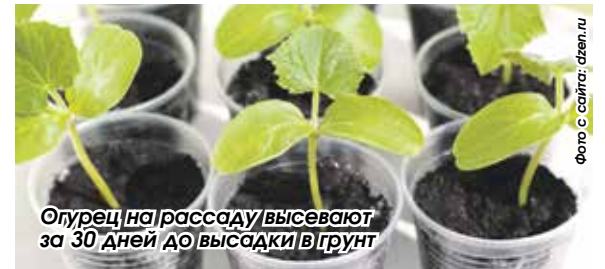
Огурец на рассаду высевают за 30 дней до высадки в грунт