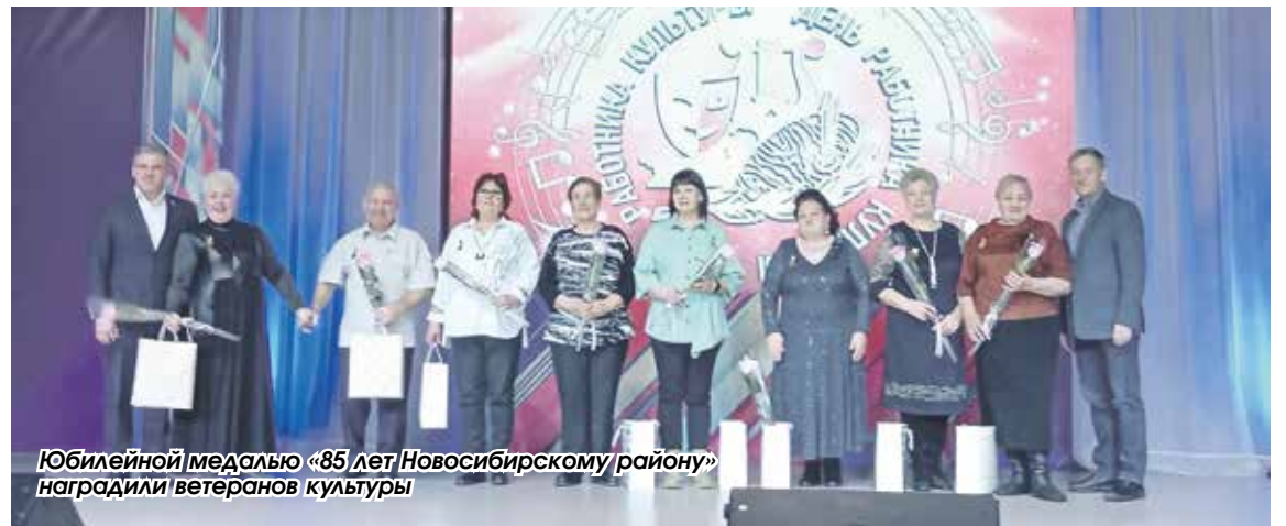
Юбилейной медалью «85 лет Новосибирскому району» наградили ветеранов культуры