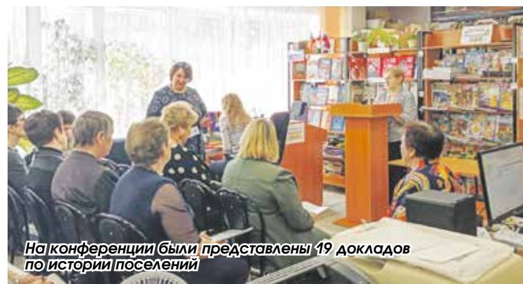
На конференции были представлены 19 докладов по истории поселений