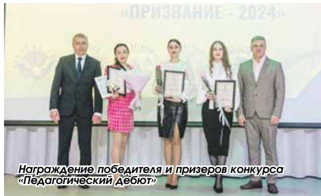
Награждение победителя и призеров конкурса «Педагогический дебют»