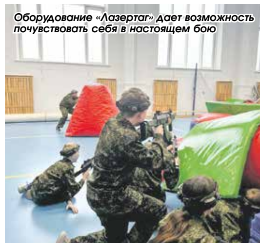
Оборудование «Лазертаг» дает возможность почувствовать себя в настоящем бою