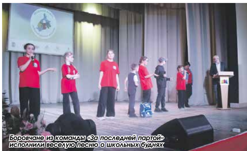
Боровчане из команды «За последней партией» исполнили веселую песню о школьных буднях