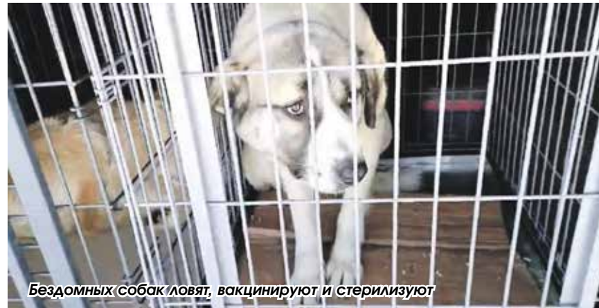
Бездомных собак ловят, вакцинируют и стерилизуют