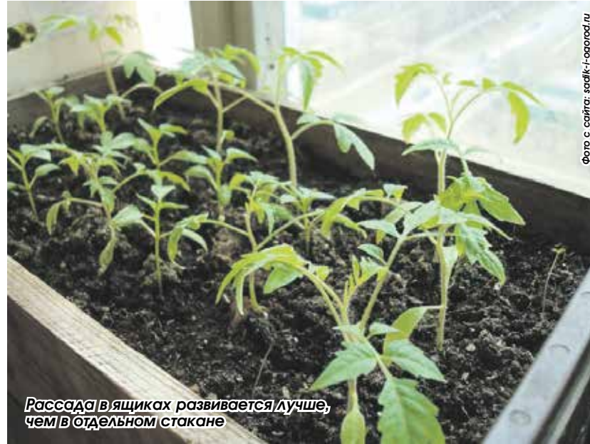
Рассада в ящиках развивается лучше, чем в отдельном стакане