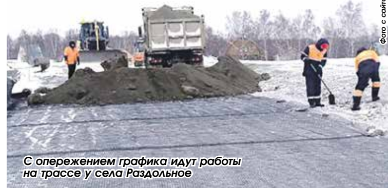
С опережением графика идут работы на трассе у села Раздольное