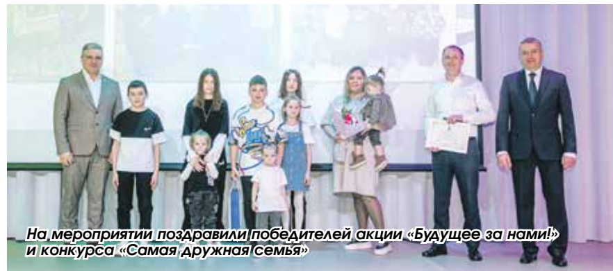
На мероприятии поздравили победителей акции «Будущее за нами!» и конкурса «Самая дружная семья»

В районе в целом, как отметила начальник управления, мы смогли обеспечить местами в детских садах детей 3–7 лет. В отдельных сельсоветах проблемы еще есть, но они постепенно решаются. Так, запланировано строительство детских садов в Каменском, Станционном сельсоветах, Краснообске, выделены денежные средства на открытие дошкольных групп полного дня в Жеребцово.