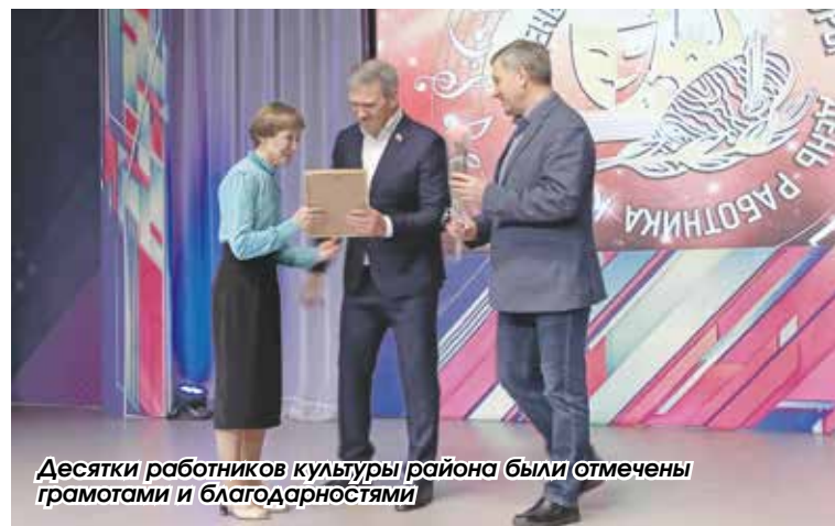
Десятки работников культуры района были отмечены грамотами и благодарностями