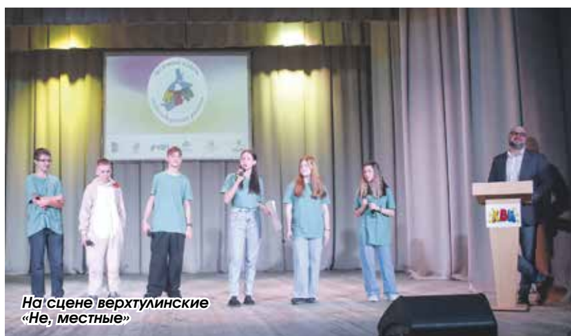
На сцене верхтулинские «Не, местные»