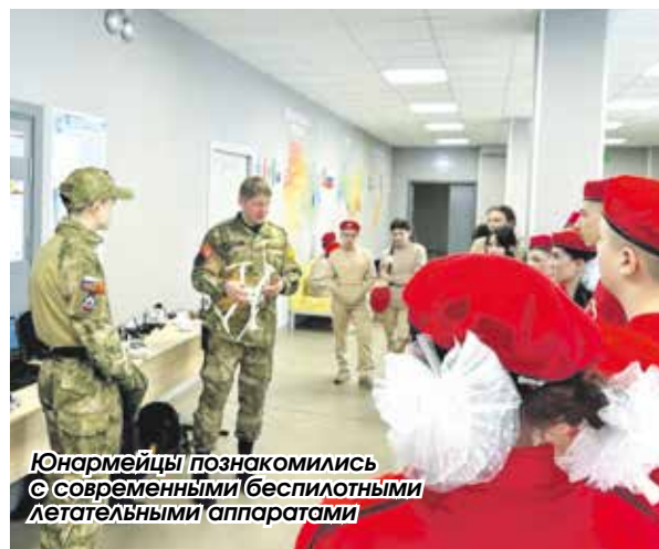
Юнармейцы познакомились с современными беспилотными летательными аппаратами

Елена Азарова