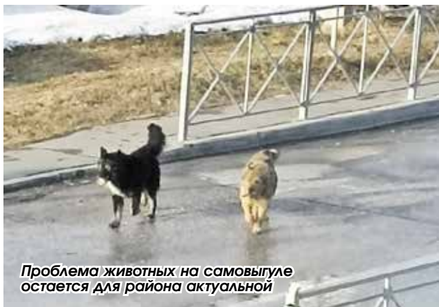
Проблема животных на самовыгуле остается для района актуальной

Владислав Кулагин