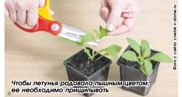
Чтобы петунья радовалась пышным цветом, ее необходимо прищипывать