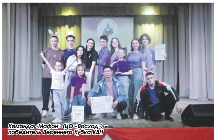
Команда «Мафон» (ЦО «Восход») – победитель Весеннего Кубка КВН