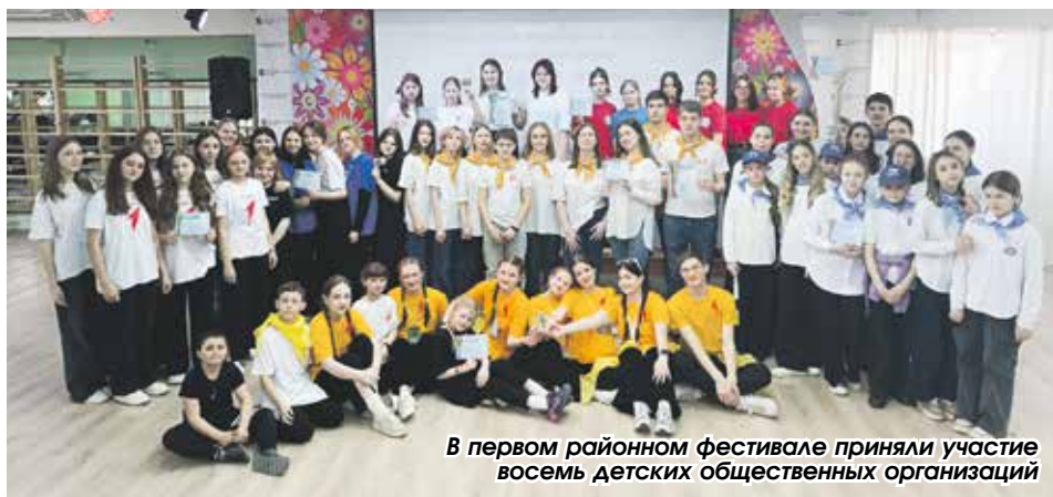
В первом районном фестивале приняли участие восемь детских общественных организаций