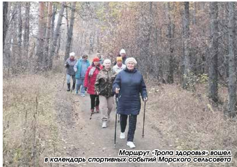
Маршрут «Тропа здоровья» вошел в календарь спортивных событий Морского сельсовета

С открытием Дома культуры после капитального ремонта в Ленинском появилась еще од-