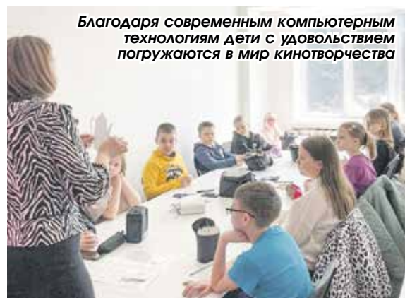
Благодаря современным компьютерным технологиям дети с удовольствием погружаются в мир кинотворчества

Елена Азарова, фото предоставлены ДХШ р. п. Краснообск