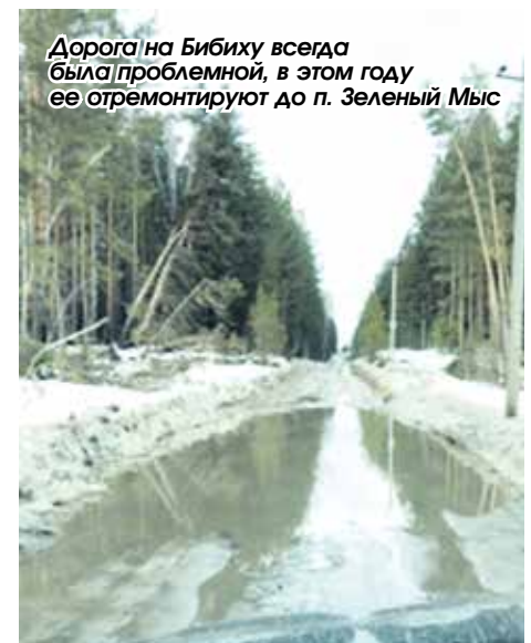
Дорога на Бибику всегда была проблемной, в этом году ее отремонтируют до п. Зеленый Мыс

Елена Азарова, фото предоставлены УК ЕЗ ЖКХС