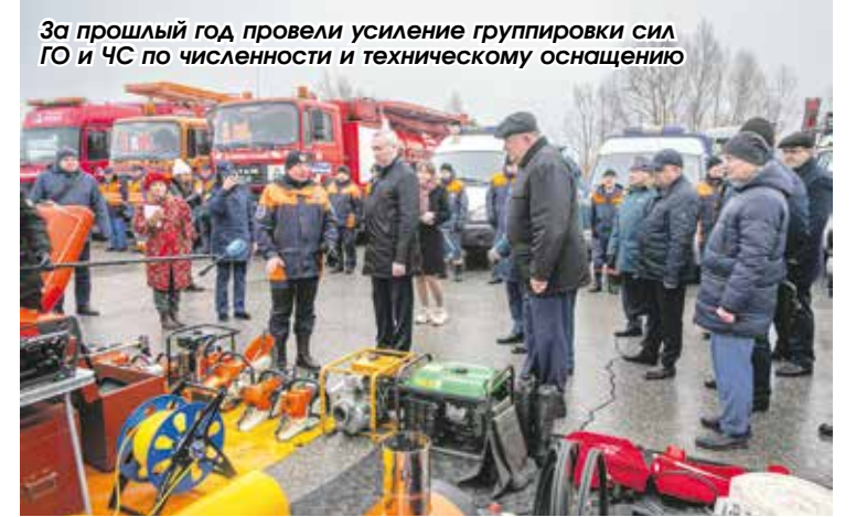
За прошлый год провели усиление группировки сил ГО и ЧС по численности и техническому оснащению