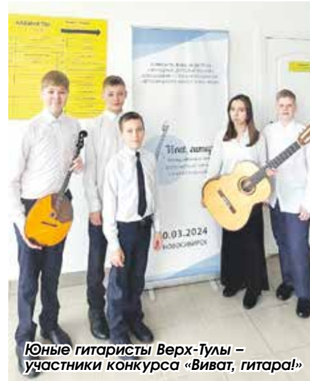
Юные гитаристы Верх-Тулы – участники конкурса «Виват, гитара!»