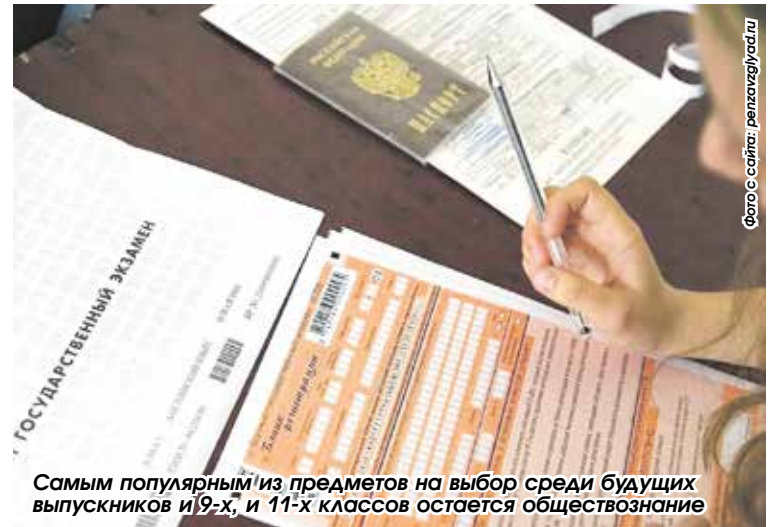
Самым популярным из предметов на выбор среди будущих выпускников и 9-х, и 11-х классов остается обществознание

Новшества в контрольно-измерительных материалах ОГЭ в этом году минимальные. Изменения коснутся только русского языка и литературы. В ОГЭ по русскому языку появились четыре новых задания с краткими ответами по пунктуации, орфографии и грамматике, скорректирована формулировка сочинения-рассуждения, есть некоторые изменения в критериях оценивания