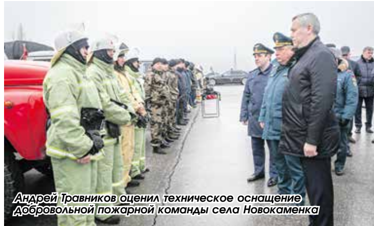
Андрей Травников оценил техническое оснащение добровольной пожарной команды села Новокаменка