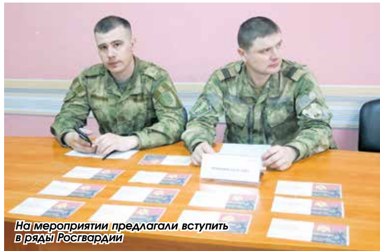
На мероприятии предлагали вступить в ряды Росгвардии