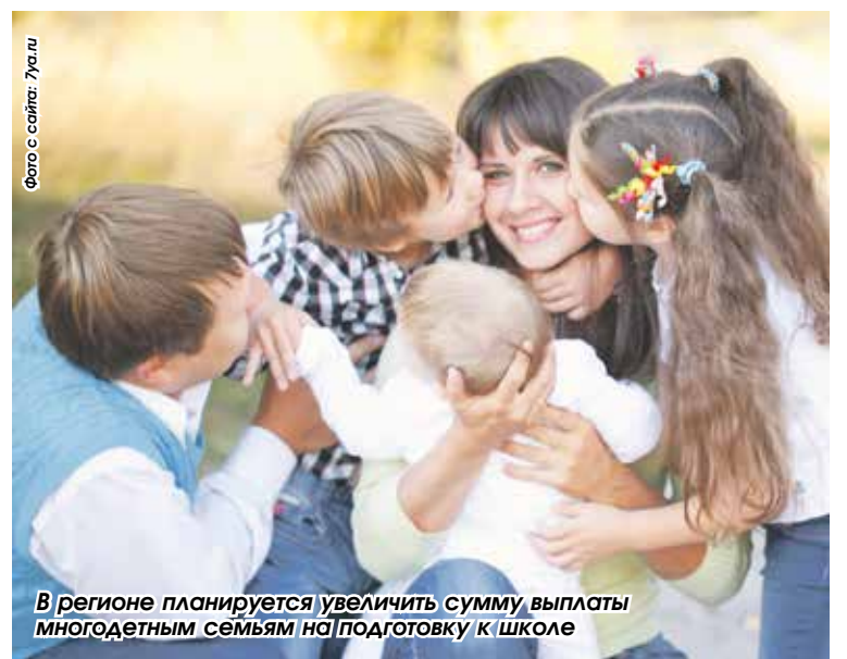
В регионе планируется увеличить сумму выплаты многодетным семьям на подготовку к школе

По информации пресс-службы Заксобрания НСО