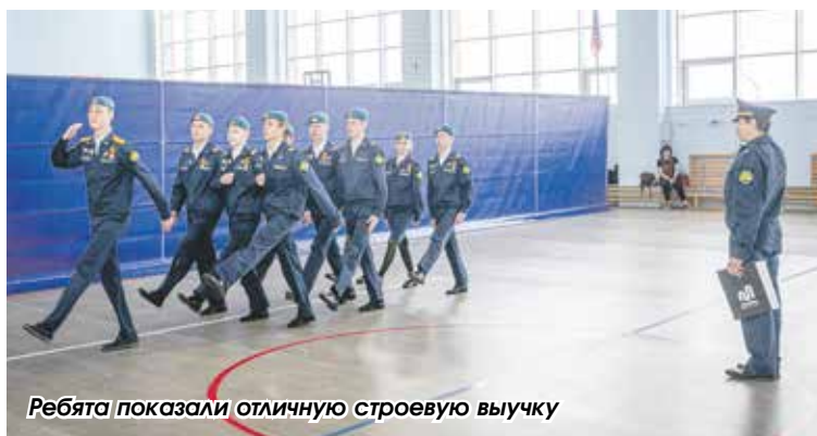
Ребята показали отличную строевую выучку