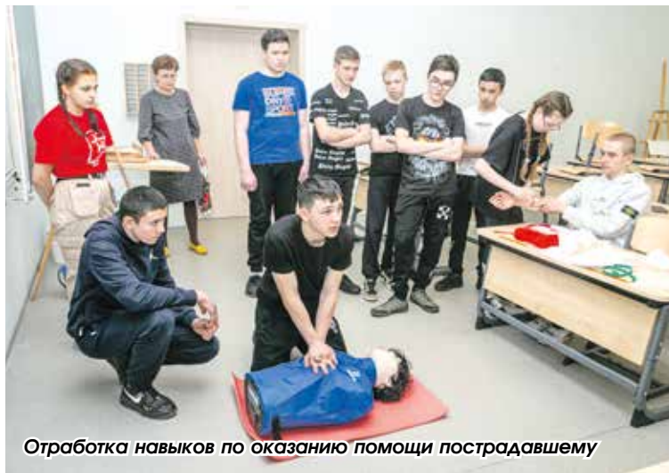
Отработка навыков по оказанию помощи пострадавшему