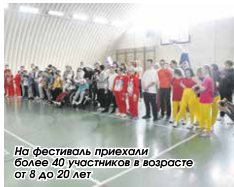
На фестиваль приехали более 40 участников в возрасте от 8 до 20 лет