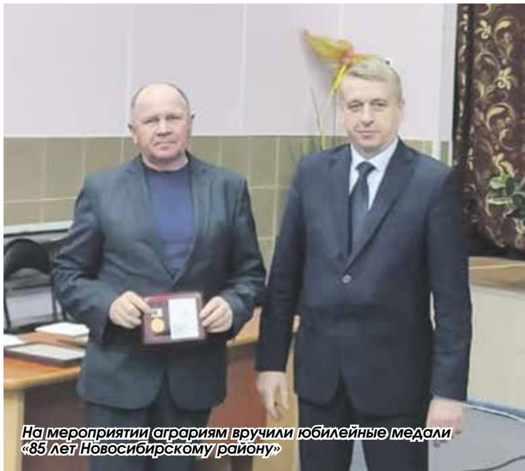
На мероприятии аграриям вручили юбилейные медали «85 лет Новосибирскому району»