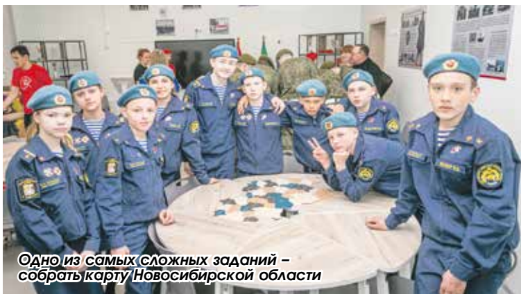
Одно из самых сложных заданий – собрать карту Новосибирской области