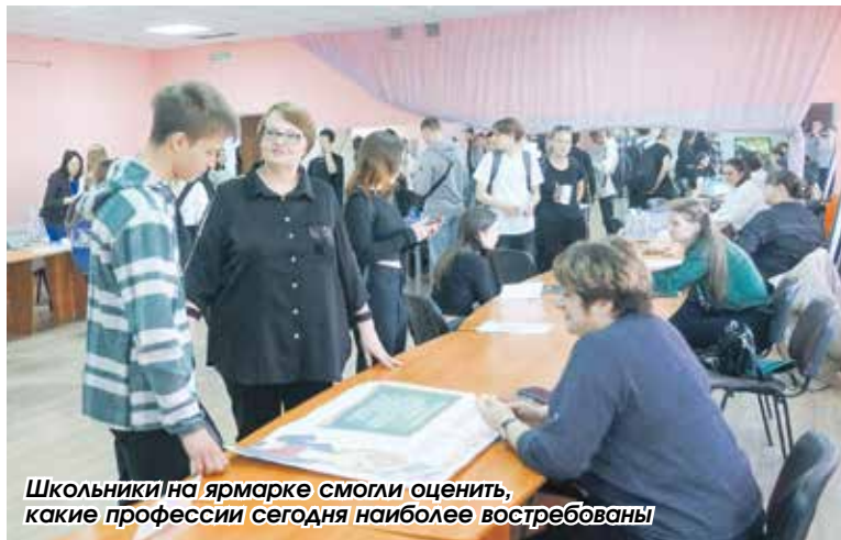
Школьники на ярмарке смогли оценить, какие профессии сегодня наиболее востребованы