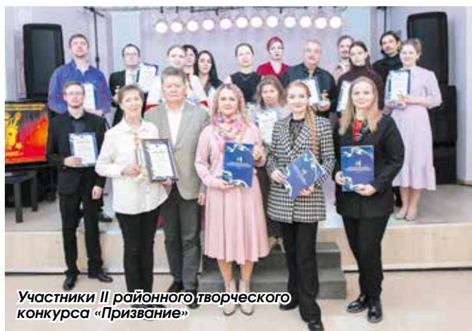
Участники II районного творческого конкурса «Призвание»

Подготовила Татьяна Кузина, фото предоставлены районным управлением культуры