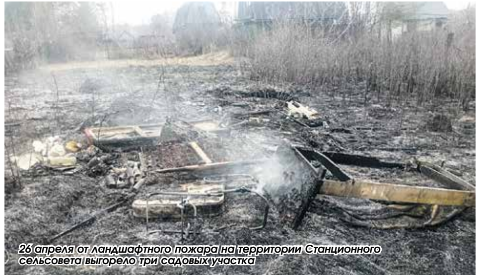
26 апреля от ландшафтного пожара на территории Станционного сельсовета выгорело три садовых участка

– По завершении особого противопожарного режима можно будет сжигать мусор, траву, листву и иные отхо-