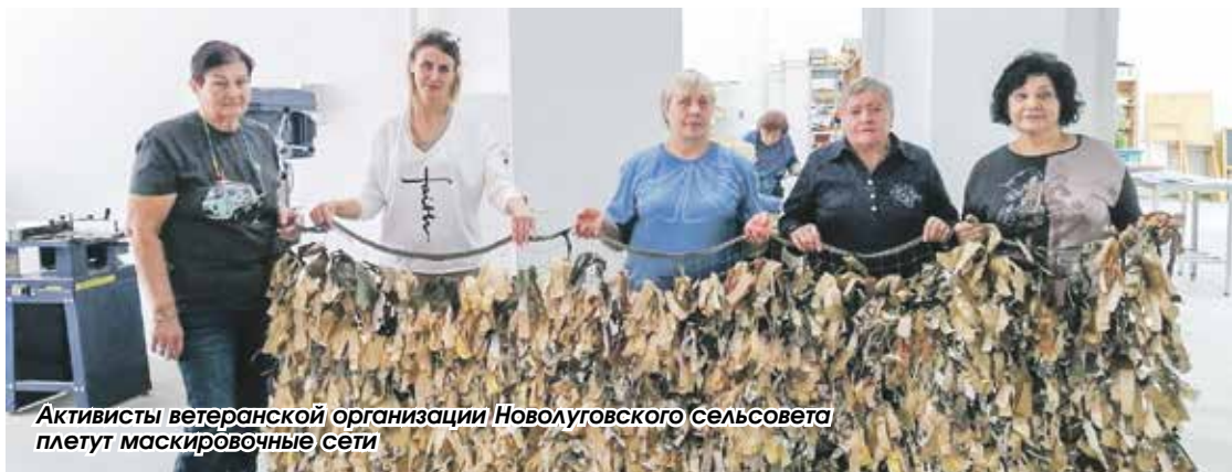
Активисты ветеранской организации Новолуговского сельсовета плетут маскировочные сети

В Новосибирском районе прошел очередной пленум районного Совета ветеранов, на котором обсудили актуальные для людей старшего возраста вопросы.