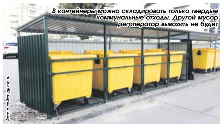
В контейнеры можно складировать только твердые коммунальные отходы. Другой мусор регоператор вывозить не будет

районной администрации и региональный оператор напоминают, что контейнеры предназначены лишь для твердых коммунальных отходов. Это остатки еды, упаковки, предметы из бумаги, пластика, стекла. Крупногабаритные отходы (КГО) – бытовая техника, сантехника, мебель – размещаются только на площадке для КГО или в специальном контейнере. Этот мусор регоператор вывозит по отдельному графику.