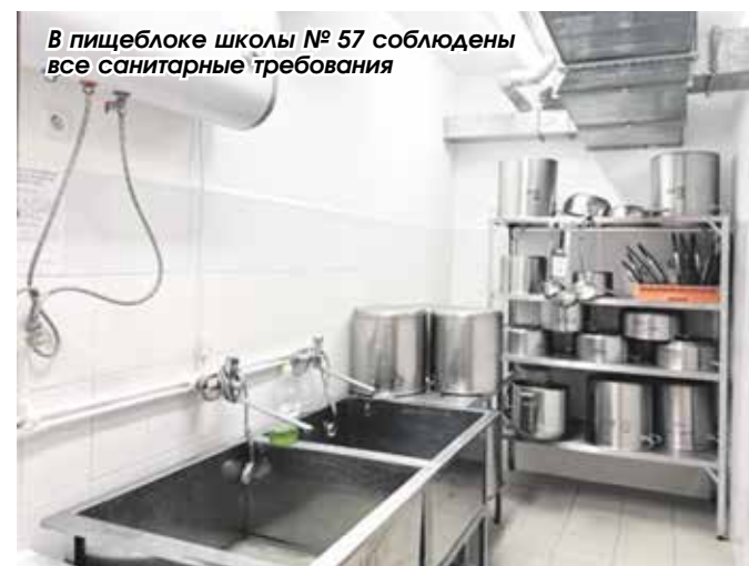
В пищеблоке школы № 57 соблюдены все санитарные требования