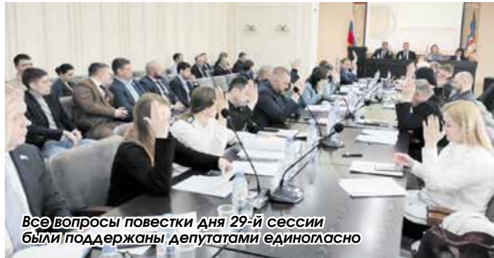
Все вопросы повестки дня 29-й сессии были поддержаны депутатами единогласно

На 29-й сессии депутаты района утвердили исполнение бюджета, рассмотрели ряд изменений в Устав муниципалитета и оценили ход подготовки к проведению в районе летней оздоровительной кампании.