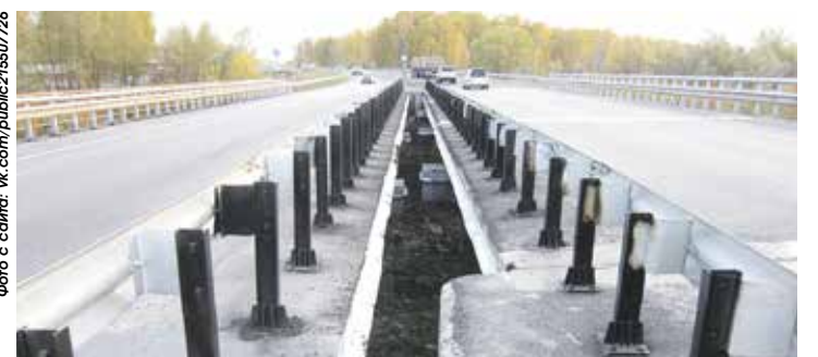
Два железобетонных моста через Верхнюю Тулу отремонтируют в этом году