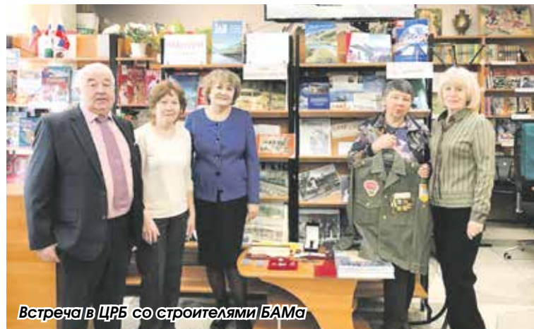
Встреча в ЦРБ со строителями БАМа

К мероприятиям библиотека подготовила обширную экспозицию, куда вошли не только книги и статьи, но и весьма редкие экспонаты, любезно предоставленные ветеранами. Это книги из личных библиотек, фотографии, коллекция значков, медали, грамоты, наградные часы, комсомольские билеты и даже настоящая бамовская куртка с эмблемой отряда.