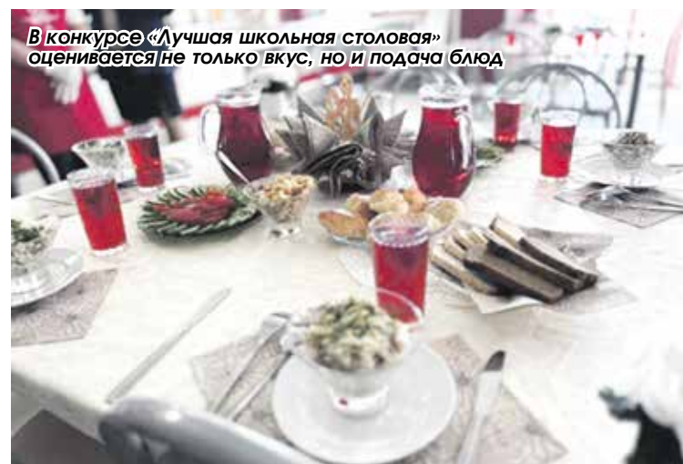
В конкурсе «Лучшая школьная столовая» оценивается не только вкус, но и подача блюд