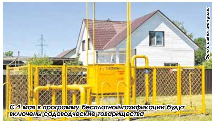
С 1 мая в программу бесплатной газификации будут включены садоводческие товарищества