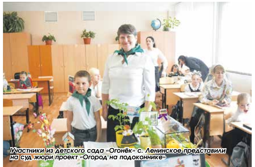
Участники из детского сада «Огонёк» с. Ленинское представили на суд жюри проект «Огород на подоконнике»

ребята, покажите, на что вы способны. Поверьте, от вас зависит будущее России!»