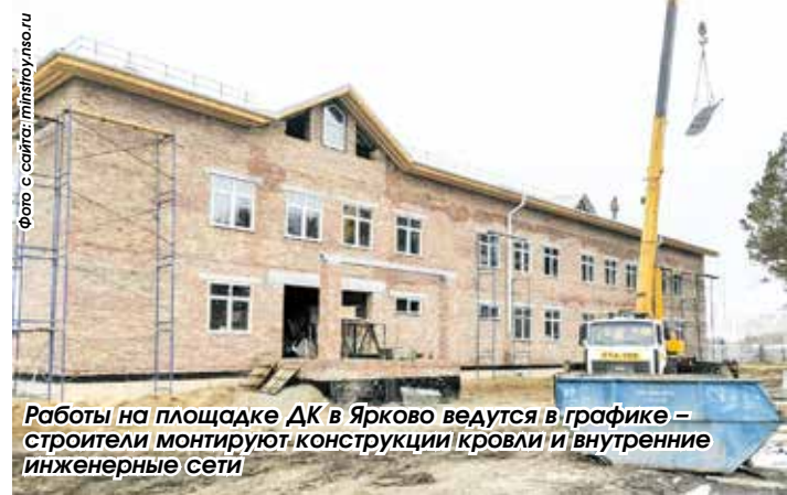
Работы на площадке ДК в Ярково ведутся в графике – строители монтируют конструкции кровли и внутренние инженерные сети