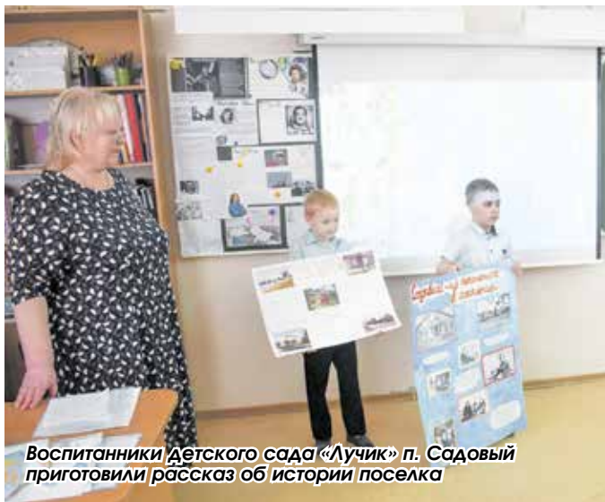
Воспитанники детского сада «Лучик» п. Садовый подготовили рассказ об истории поселка