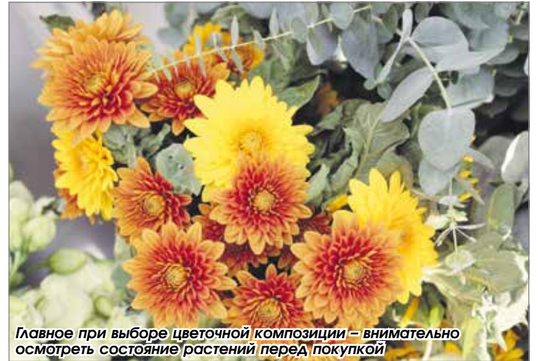
Главное при выборе цветочной композиции – внимательно осмотреть состояние растений перед покупкой

Акация серебристая, которую многие знают под названи-