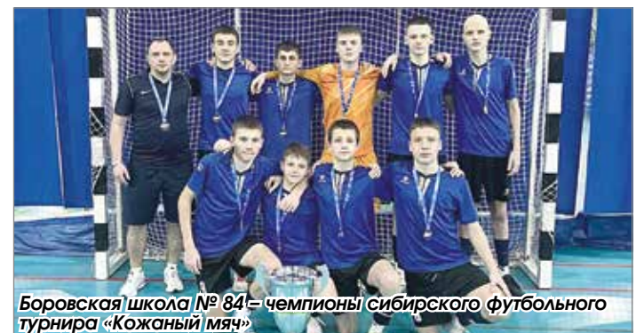
Боровская школа № 84 – чемпионы сибирского футбольного турнира «Кожаный мяч»

Подготовила Елена Азарова