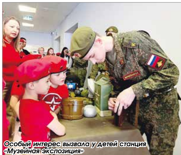
Особый интерес вызвала у детей станция «Музейная экспозиция»