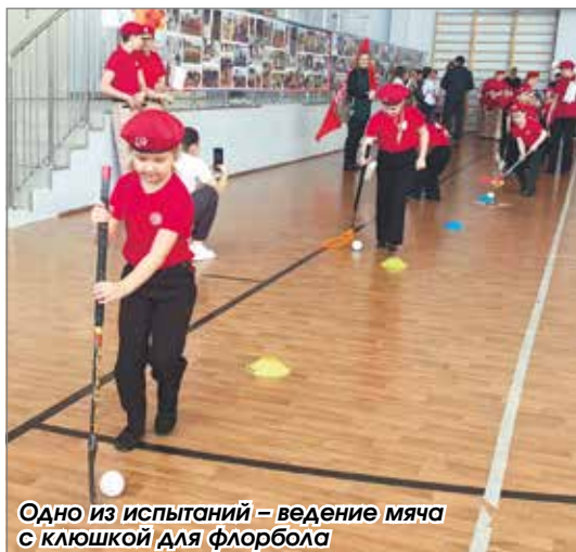
Одно из испытаний – ведение мяча клюшкой для флорбола

Особый интерес вызвала у детей станция под названием «Музейная экспозиция», где малышам рассказывали о военном обмундировании, аппаратуре, оружии. Они внимательно