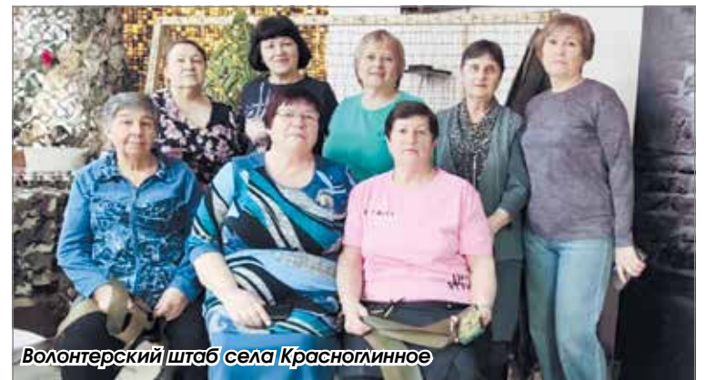
Волонтерский штаб села Красноглинное

Отмечены были наши волонтеры и на празднике в Толмачёвской школе № 61, который организовали педагоги школы