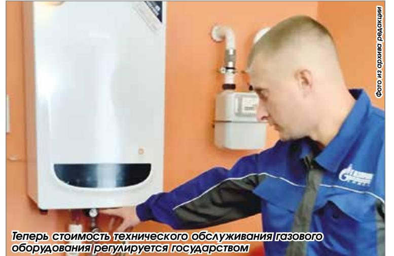
Теперь стоимость технического обслуживания газового оборудования регулируется государством

Меняется расчет алиментов. Вместо минимального размера оплаты труда теперь он будет привязан к среднемесячной зарплате в конкретном регионе. Это сделает выплаты более справедливыми и соответствующими уровню жизни. Если родители не договорились, то размер алиментов рассчитывается по общим правилам: на одного