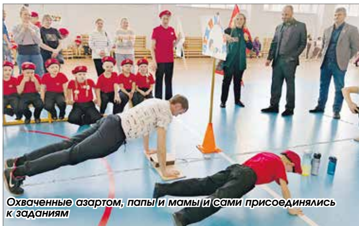
Охваченные азартом, папы и мамы (и сами) присоединялись к заданиям