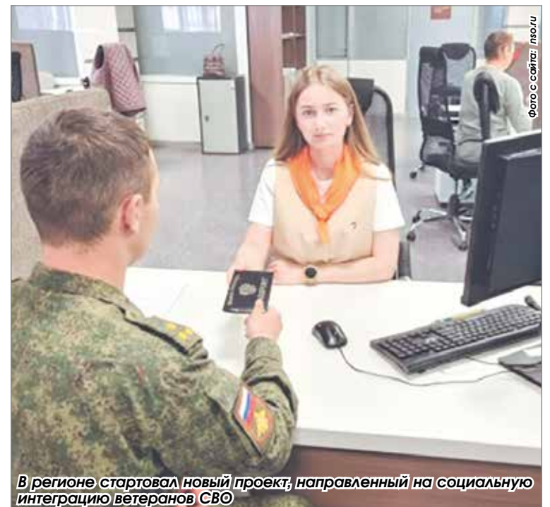
В регионе стартовал новый проект, направленный на социальную интеграцию ветеранов СВО

Все разработанные материалы будут размещены в архиве на постоянной интернет-плат-