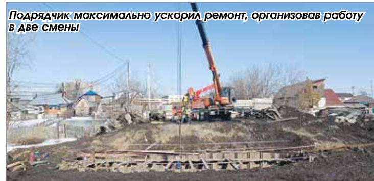
Подрядчик максимально ускорил ремонт, организовав работу в две смены