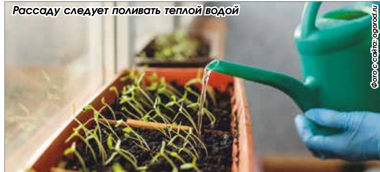
Рассаду следует поливать теплой водой