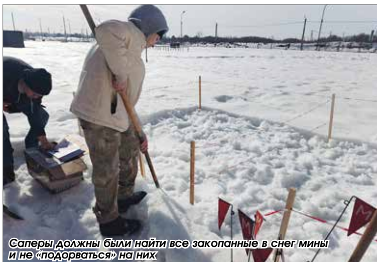
Саперы должны были найти все закопанные в снег мины и не «подорваться» на них

жие на предохранитель, и за то, что один из них встал перед напарником с оружием. «Штрафы жестокие! – поделились парни впечатлениями от прохождения своего этапа. – Мы тренировались, готовились, но волнительно было, вот и совершили ошибки. Ну и время на тренировках показывали получше – тут старались всё обдумывать, вот и передвигались медленно».