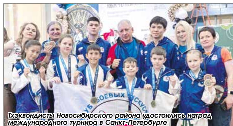
Тхэквондисты Новосибирского района удостоились наград международного турнира в Санкт-Петербурге

Подготовил Владислав Кулагин