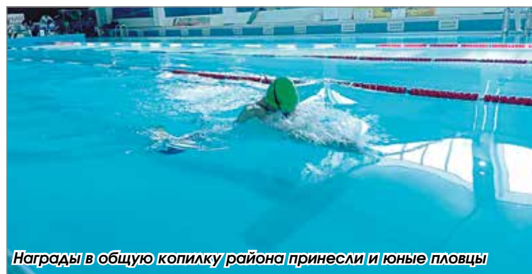
Награды в общую копилку района принесли и юные пловцы

Подготовил Владислав Кулагин