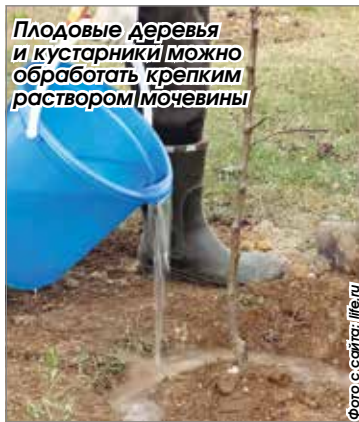
Плодовые деревья и кустарники можно обработать крепким раствором мочевины