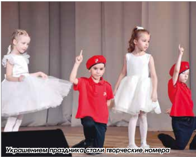
Украшением праздника стали творческие номера