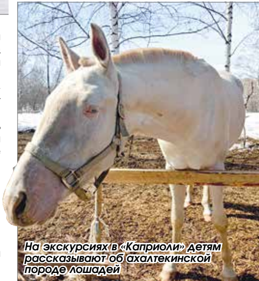
На экскурсиях в «Каприоли» детям рассказывают об ахалтекинской породе лошадей