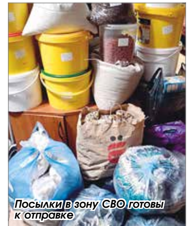
Посылки в зону СВО готовы к отправке