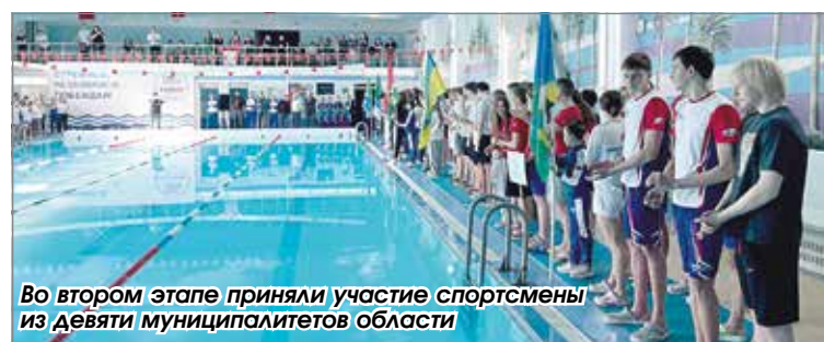
Во втором этапе приняли участие спортсмены из девяти муниципалитетов области