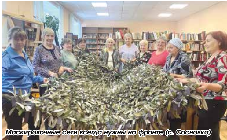
Маскировочные сети всегда нужны на фронте (с. Сосновка)