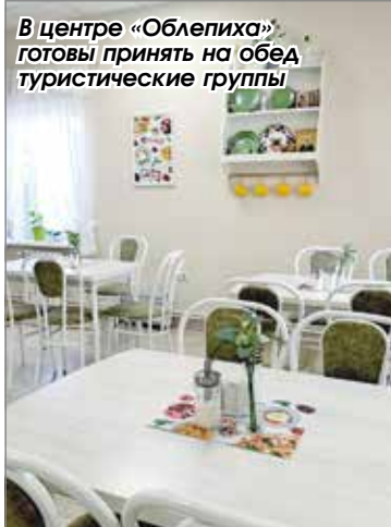
В центре «Облепиха» готовы принять на обед туристические группы