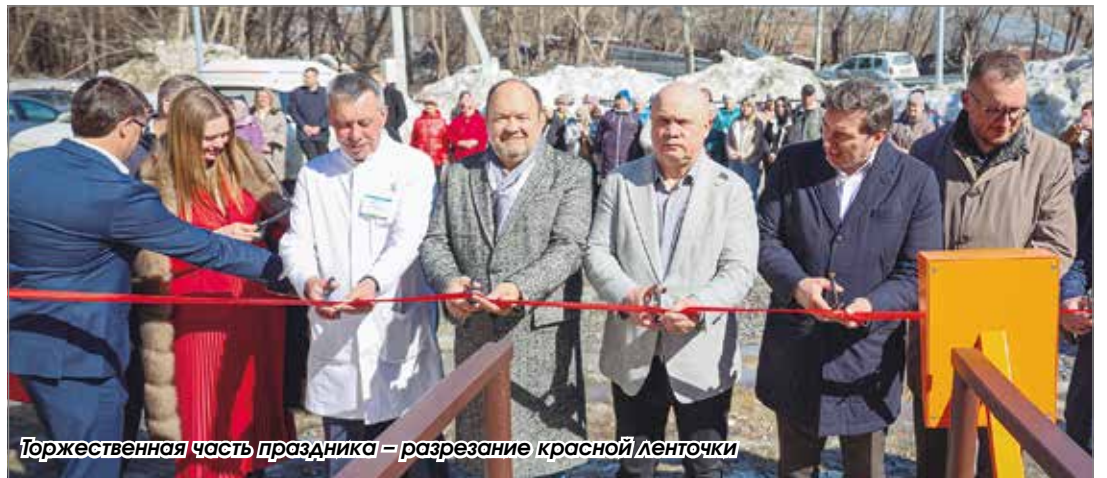
Торжественная часть праздника – разрезание красной ленточки

Ровно в назначенный час у входа в новое здание собрались почетные гости. Среди них – замгубернатора Новосибирской области Константин Хальзов, заместитель министра здравоохранения региона Александр Колупаев, депутаты Законодательного Собрания Игорь Гришунин и Владислав Плотников, временно исполняющая обязанности руководителя территориального органа Росздравнадзора Светлана Сгибнева, начальник управле-