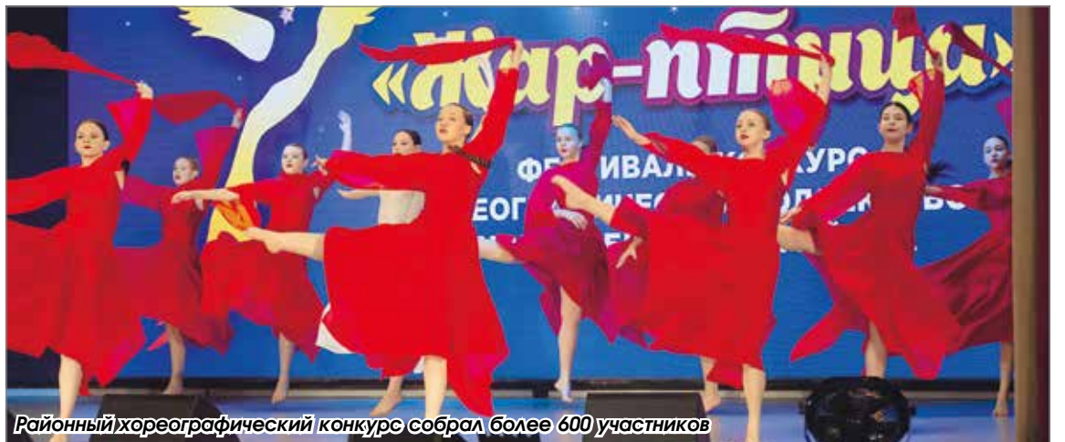
Районный хореографический конкурс собрал более 600 участников