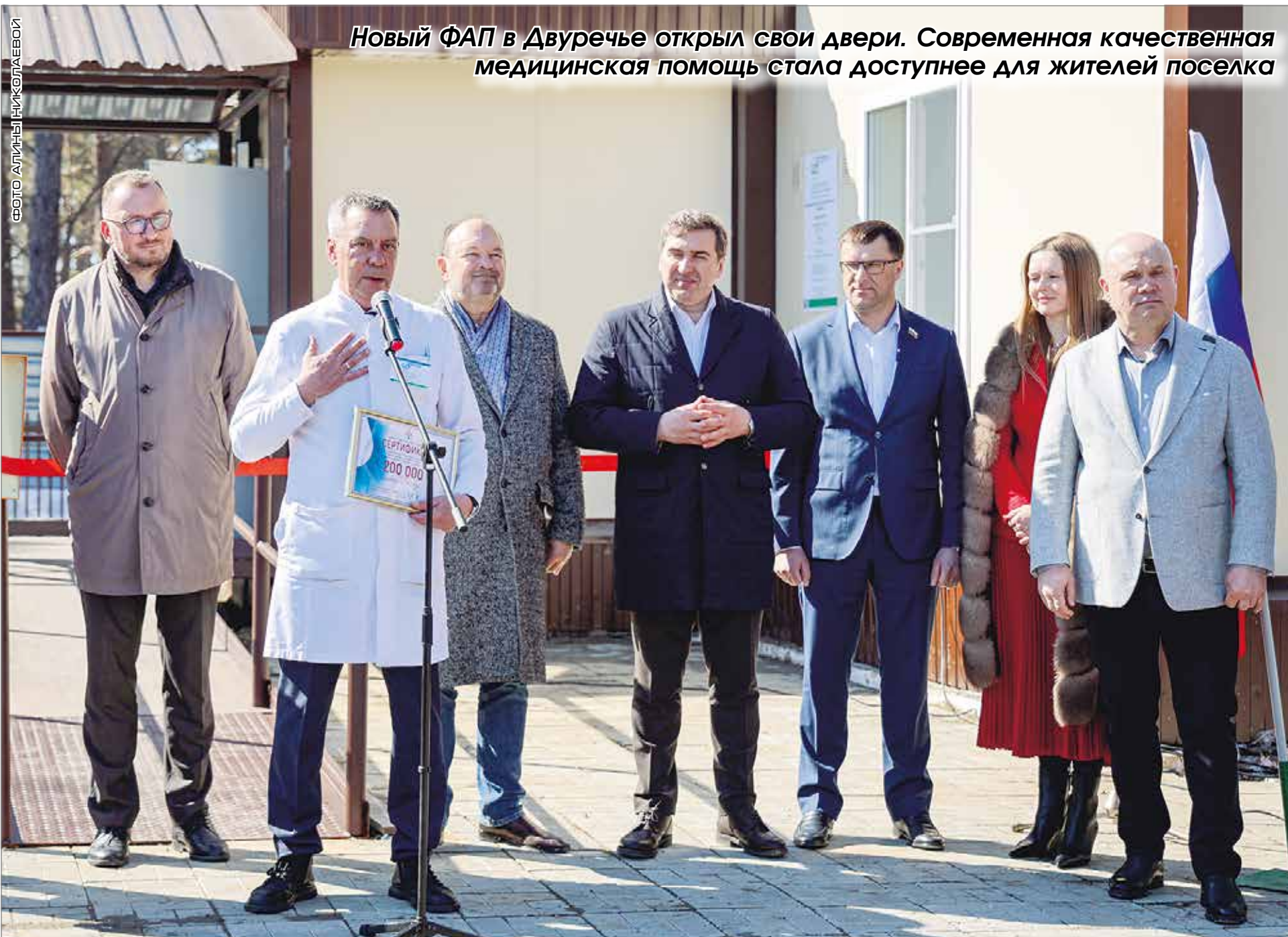
Новый ФАП в Двуречье открыл свои двери. Современная качественная медицинская помощь стала доступнее для жителей поселка

Информационно-аналитическое издание. Новосибирская область. Новосибирский район