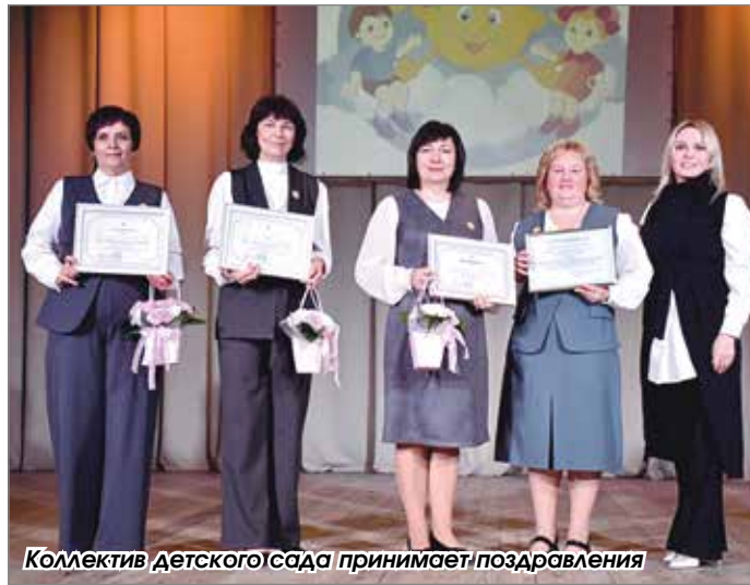
Коллектив детского сада принимает поздравления