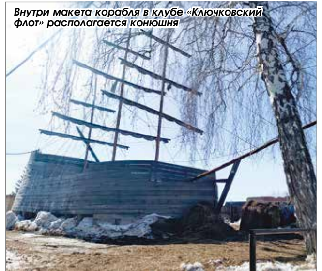
Внутри макета корабля в клубе «Ключковский флот» располагается конюшня

Отведав пищи насущной, пора подумать и о пище духовной – сразу через дорогу стоит храм в честь иконы Божией Матери Скоропослушница. Место известное среди людей верующих, ведь в нем хранится чудотворная Иверская икона Пресвятой Богородицы. История ее возвращения церкви – повод для отдельной статьи. Или для интересного рассказа экскурсовода. Но побывать здесь для человека верующего – обязательный пункт программы путешествия по Станционному сельсовету.