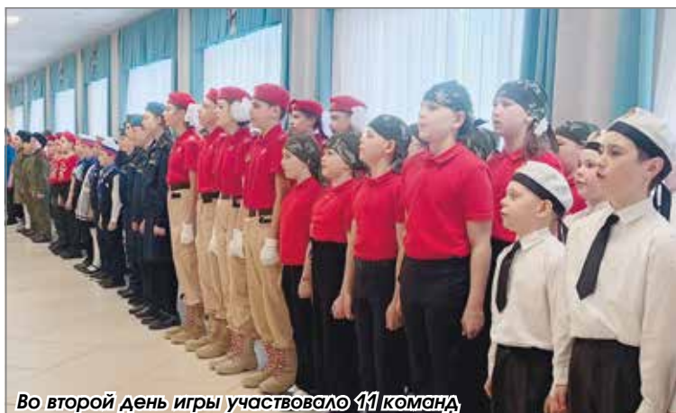
Во второй день игры участвовало 41 команда

Соревнования операторов БПЛА, состязания саперов, демонстрация навыков строевой подготовки – всё это и не только входит в задания Всероссийской военно-патриотической игры «Зарница 2.0». Муниципальный этап игры прошёл 31 марта и 1 апреля в Центре образования «Верх-Тулинский».