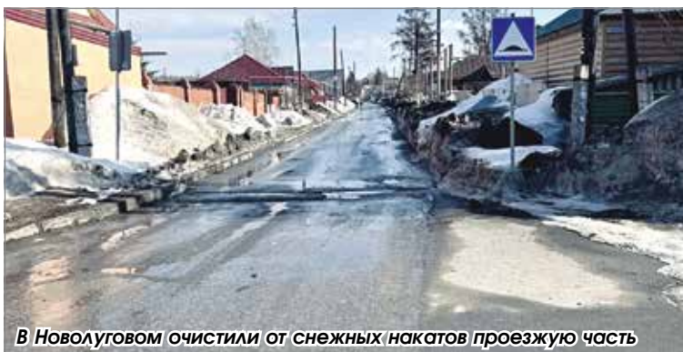
В Новолуговом очистили от снежных накатов проезжую часть

А вот в Ярковском сельсовете не отреагировали на замечания, сделанные специалистами районной администрации. При этом дороги в селе Ярково были