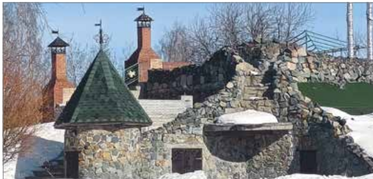
В резиденции Sagittarius («Сагиттариус») путешественников ждет живописная территория с каминным залом, внешне похожим на крепость в скале

При этом здесь готовы и к приему групп до 30 человек: сотрудники «Каприоли» проводят экскурсии для учеников местных школ. И готовы при-