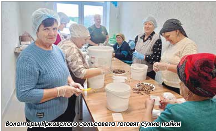
Волонтеры Яркового сельсовета готовят сухие пакеты