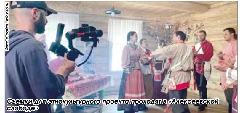
Съемки для этнокультурного проекта проходят в «Алексеевской слободе»