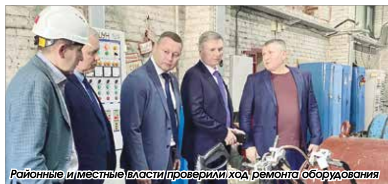
Районные и местные власти проверили ход ремонта оборудования

Затем приступили к текущему ремонту на магистральном трубопроводе от котельной до Краснообска, что позволило заполнить водой этот участок теплосети и 1 июня приступить ко второму этапу гидравлических испытаний. Параллельно ведутся работы в котельной, уже за счет собственных средств предприятия. В планах – замена запорной арматуры сетевых насосов на пониженной насосной станции, капитальный ремонт газоходов и котлов, замена компенсаторов, текущий ремонт прочего оборудования. Особое внимание уделяют состоянию административных помещений и цеха по подготовке воды для отопительной системы. Подрядная организация ООО «Спецжелезобетонстрой» выполняет ремонт внутренней поверхности дымовой трубы.