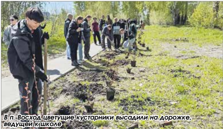
В п. Восход цветущие кустарники высадили на дорожке, ведущей к школе