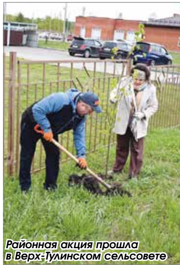
Районная акция прошла в Верх-Тулинском сельсовете