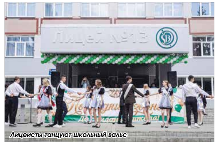
Лицейисты танцуют школьный вальс