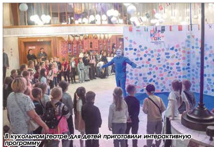
В кукольном театре для детей подготовили интерактивную программу

Эта история не нуждается в представлении, по популярности она не уступает любимым «Сказке о рыбаке и рыбке», «Сказке о царе Салтане». Легкий, отточенный слог, сочный юмор, атмосфера волшебства – вот за что любят «Конька-Горбунка». Взяв за основу русские народные сказки, Пётр Ершов создал произведение, где что ни строчка, то крылатая фраза. История Ивана и его четвероногого друга нашла воплощение не только на бумаге. Приключения героев четырежды экранизировали, а количество спектаклей вряд ли поддаётся счету.