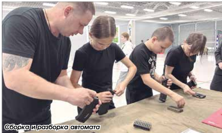
Сборка и разборка автомата

Подготовила Татьяна Кузина