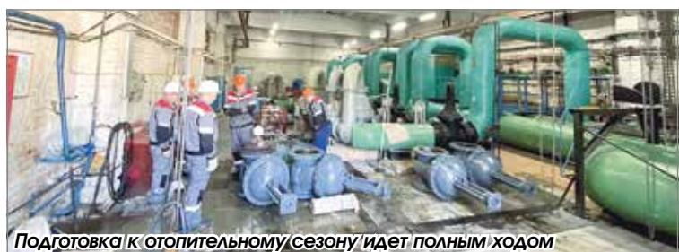
Подготовка к отопительному сезону идет полным ходом

Подготовила Татьяна Кузина