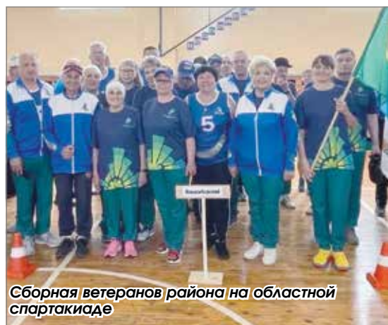
Сборная ветеранов района на областной спартакиаде

Наши ветераны в упорной борьбе взяли медали высшей пробы в легкой атлетике, городском спорте, стритболе, настольном теннисе, мини-футболе, шахматах. Также у нас бронзовая медаль в стрельбе. Она не дает выход в финал, но сама по себе – прекрасный результат! И мы гордимся каждым нашим спортсменом