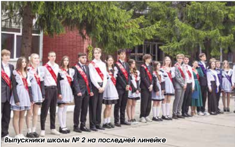
Выпускники школы № 2 на последней линейке