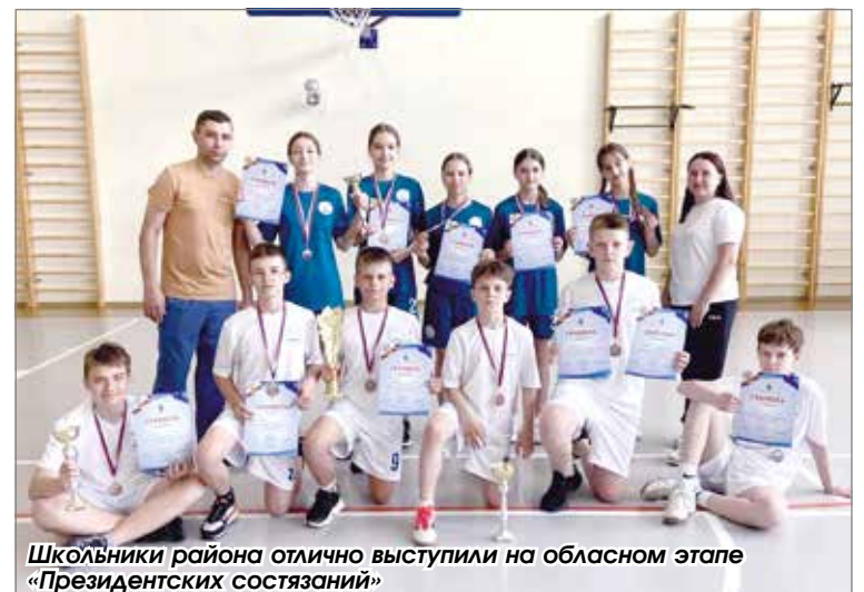
Школьники района отлично выступили на областном этапе «Президентских состязаний»

Подготовила Татьяна Кузина, фото предоставлено районным управлением образования