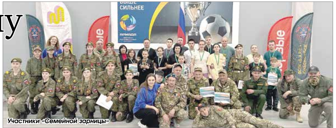
Участники «Семейной зарницы»

Впервые в этом году прошел муниципальный этап игры. Семьи Новосибирского района встретились 31 мая в Краснообске, в СК «Армада». Организаторами выступили местное отделение «Движения первых», районное управление образования и управление по работе с органами местного самоуправления, общественными организациями и молодежной политикой, с проведением помогли краснообский военно-спортивный патри-