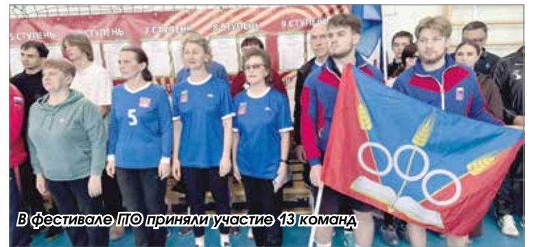
В фестивале ГТО приняли участие 13 команд