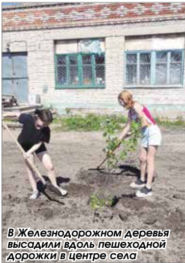
В Железнодорожном деревье высадили вдоль пешеходной дорожки в центре села