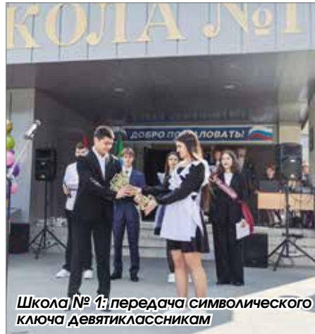
Школа № 1: передача символического ключа девятиклассникам