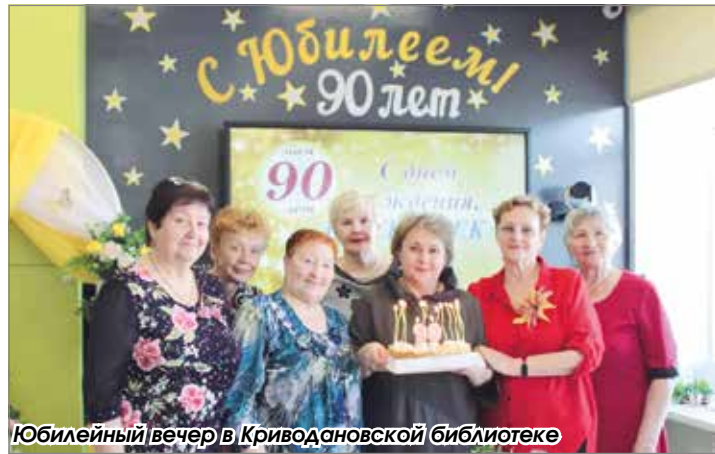
Юбилейный вечер в Криводановской библиотеке