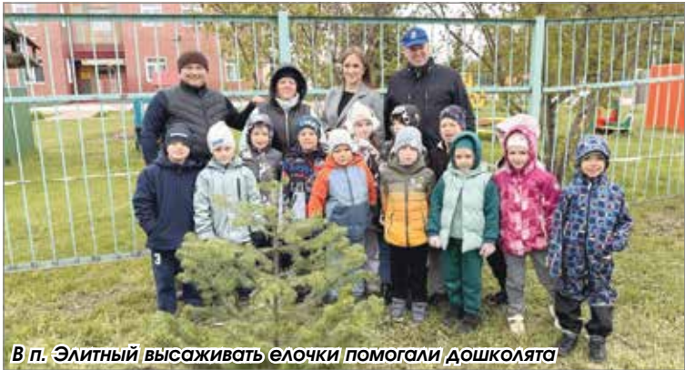
В п. Элитный высаживать елочки помогли дошколята

В Новосибирском районе стартовала традиционная акция «Мой зеленый район». Субботники проходят во многих муниципальных образованиях. Молоденькие деревца высаживают на территориях образовательных организаций, у мемориалов, на общественных пространствах.