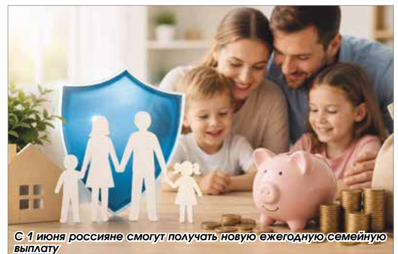
С 1 июня россияне смогут получать новую ежегодную семейную выплату

С 1 июня россияне получают больше контроля над своими биометрическими данными. Теперь можно официально