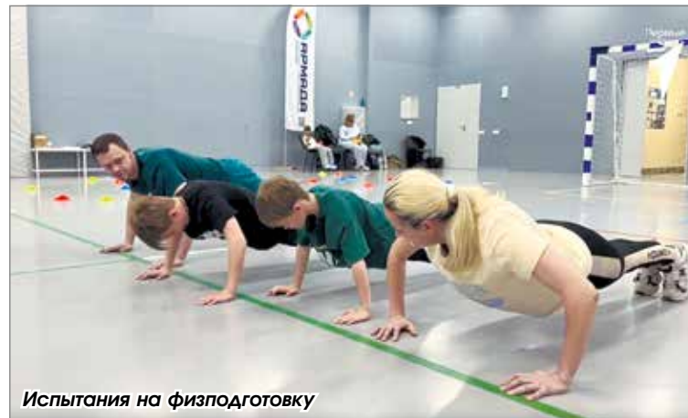
Испытания на физподготовку